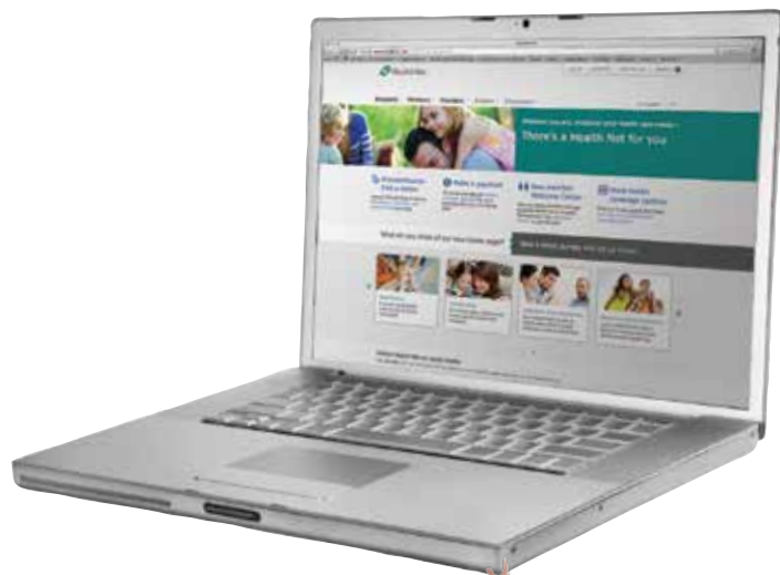
Nicole daLomba, Health Net Proporcionamos a los afiliados lo que necesitan.